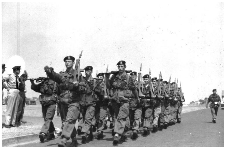
Le peloton du Lieutenant Le Grelle

La veille a lieu la cérémonie d'adieu des troupes belges et la relève par celles de l'ONU en présence du Ministre des Affaires Africaines, le Comte Harold d'Aspremont Lynden, ancien chef de Corps du 3 ième Régiment de Guides, major au 2 ième Guides et témoin particulièrement ému de la présence de Guides à cette cérémonie.