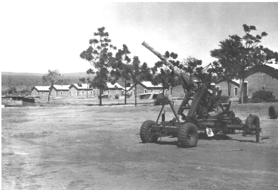
Le canon Bofors 40mm

Pour le commandement belge, c'est la sécurité des ressortissants européens et des nombreux belges de Nzilo qui est en jeu. Les 200 hommes de la garnison seront bientôt à court de vivres et le paiement de leur solde par le gouvernement de Léopoldville à la fin du mois est incertain : une descente sur Kolwezi pour piller est donc aussi à craindre.